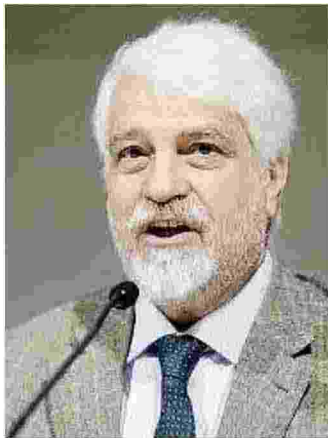
Il protagonista. Gianni Silvestrini

BRESCIA. Mercoledì 19 aprile, nel Salone dell'Apollo di Palazzo Martinengo Palatini, in Piazza del mercato, sede del Rettorato dell'Università degli Studi di Brescia, si terrà la conferenza aperta a tutti sul tema «Il ruolo delle rinnovabili nella transizione ecologica». Protagonista l'intervento di Gianni Silvestrini, direttore scientifico del Kyoto Club, organizzazione di enti, imprese e amministrazioni